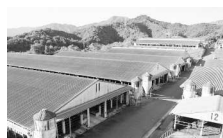
(有)延岡農協畜産センター