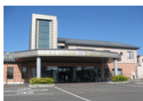
(株)プリエール延岡