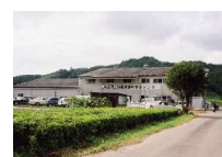
(株)JA延岡地域農業振興支援センター